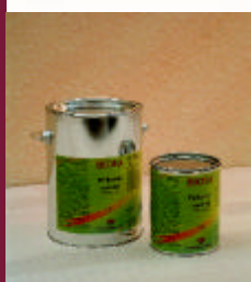
Parkettvoks Proff Art. Nr. 8059