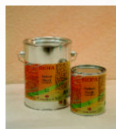
Parkett-Finish Art. Nr. 8063