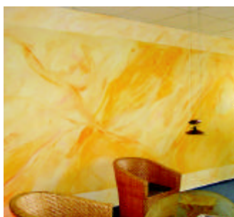
Referanse: Sven Detlefsen, Hamburg