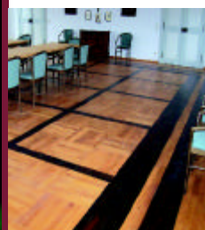
Kantine Kloster Neresheim