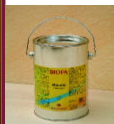
Brilliant Møbelvoks Art. nr. 8704